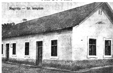
Az egykori nagyléti izraelita templom (volt Baross utcai iskola)