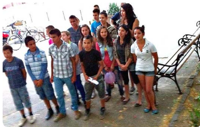
A 8.a osztály még világosan adott szerenádot.

Hagyományainkhoz híven az idei évben is szerenádokat adtak a nyolcadikos diákok az alsós és felsős tanáraiknak búcsúzóul.